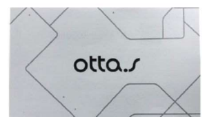
取扱説明書兼認証コード：1枚 ※認証コードは中面に記載しております。

ご不明な点やご質問は、 Qottaby サポートセンターまでご連絡ください。 WEB https://www.qottaby.jp/contact/ TEL 0570-002-910 月～金（祝・祭日を除く）9:00 ～ 18:00